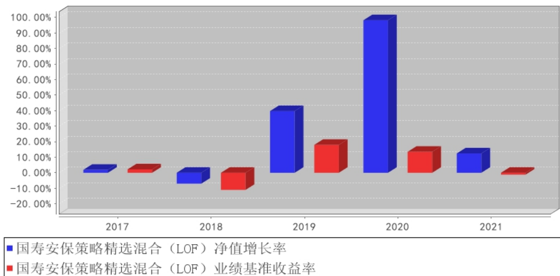
国寿安保策略精选混合（LOF）基金每年净值增长率与同期业绩比较基准收益率的对比图