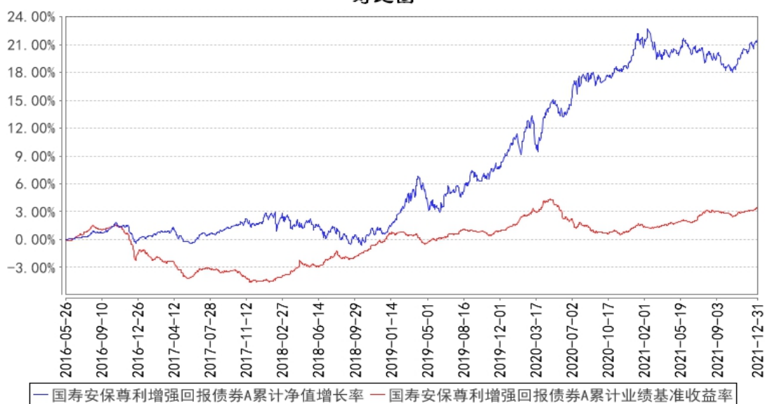
国寿安保尊利增强回报债券A累计净值增长率与同期业绩比较基准收益率的历史走势对比图